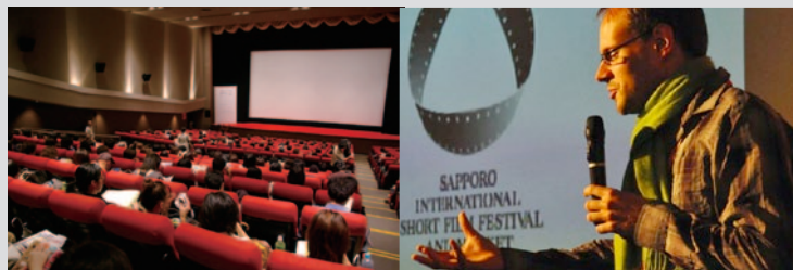
◎メイン会場: 東宝プラザ ◎マーケット会場で行われるフィルムメーカー・プレゼンテーション